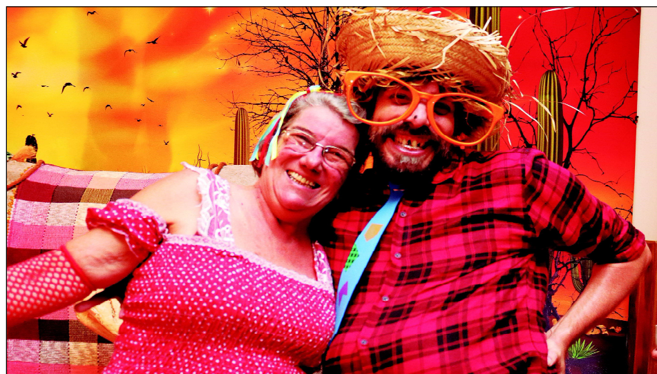
A festa também contou com performances de atores que interagiram com os associados interpretando personagens caipiras