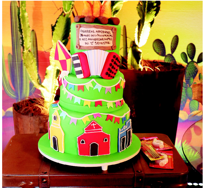
O evento também teve bolo para homenagear os aniversariantes do primeiro semestre e a APA, pelos 36 anos de atividades